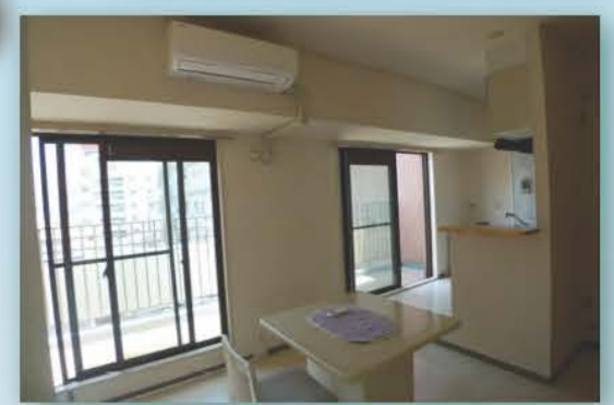
上：LDK北西角に位置する、大容量ウォークイン・クローゼットがありがたい。スッキリと暮らせそう。 下：LDK部分にエアコン付。そしてこの開口部が、資料オモテ面の「8歩も歩けるワイドバルコニー」(※503号)です。