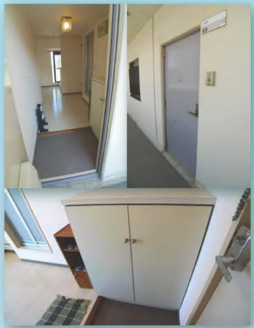
上：キッチンカウンター。奥が冷蔵庫・洗濯機置場。(503号は写真の家具付) 左：玄関と、ラベンダーグレーのドア。 下：ブーツなども収まる、大容量シューズボックス。