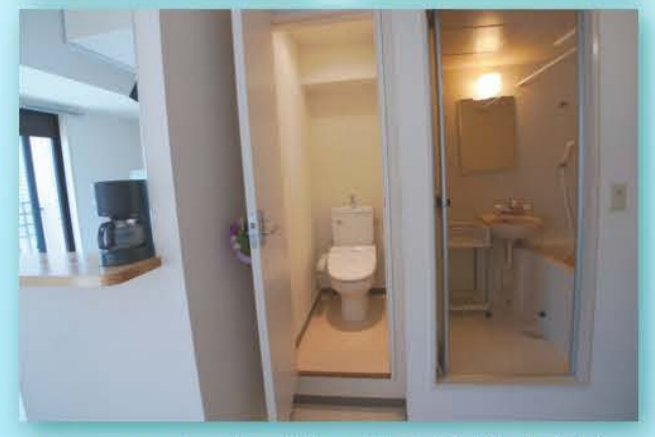
上：バストイレ別で温水洗浄式便座。 左：503号室の LDK。家具付きです。