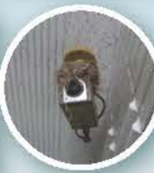
上：1Fエレベーターホール。 下：ホール奥集合ポスト。監視カメラ作動中。もう一つのカメラ上にはツバメの巣が。