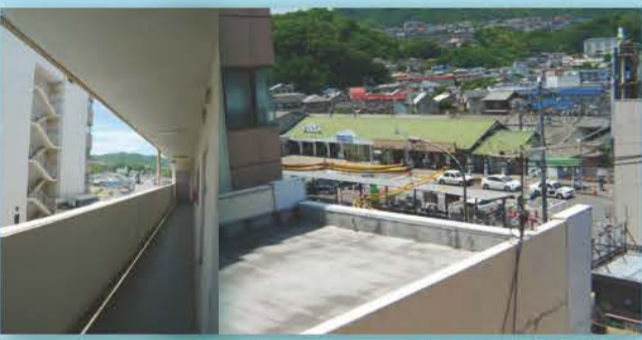
上：緑の瓦屋根が特徴の JR西広島駅を共用部から臨む。文字通りの駅前立地。